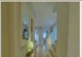
pasillo de entrada