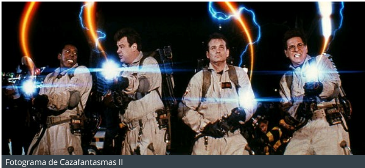
Fotograma de Cazafantasmas II

El precio de la vivienda en España sigue creciendo aunque en mayo lo ha hecho a un ritmo menor, según el último informe de la tasadora Tinsa, del que se desprende que aunque el precio medio de la vivienda terminada (nueva y usada) sigue por encima del nivel de hace un año, se ha ralentizado el ritmo de crecimiento acumulado de 2016, ya que entre enero y mayo el valor medio se ha incrementado un 1,5%, cuando en los cuatro primeros meses del año lo había